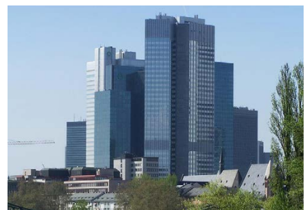
EUROTOWER, FRANKFURT AM MAIN Gebäudebetrieb/Energiebereitstellung Fördergegenstand: Wärmeerzeugung