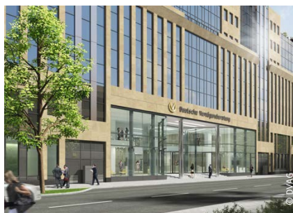
HEADQUARTER DVAG, FRANKFURT AM MAIN Revitalisierung Fördergegenstand: Technische Gebäudeausrüstung und Fassade