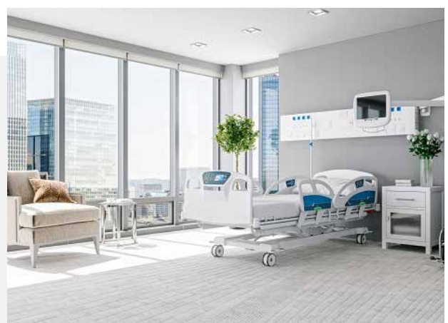
Nachhaltige und flexible Gestaltung: Pflanzen, Grünflächen, aber auch die Beleuchtung, Akustik und natürliche Materialien wirken sich positiv auf die Gesundheit der Nutzer:innen aus.