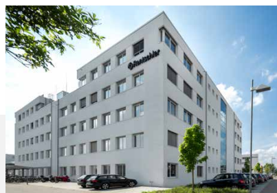
Rentschler Biopharma SE, Laupheim Neubau Laborgebäude