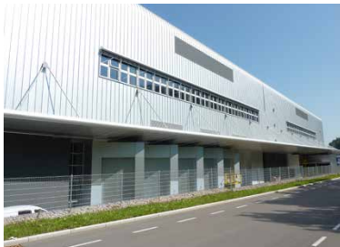
Aesculap AG, Tuttlingen Neubau Innovation Factory