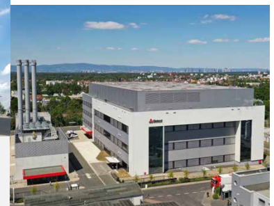
Biotest AG, Dreieich Neubau Produktionsgebäude

Ihr Partner für Neubau- und Bestandsprojekte im Life-Sciences-Bereich. Haben Sie noch Fragen? Gerne beraten wir Sie unter lifesciences@dreso.com