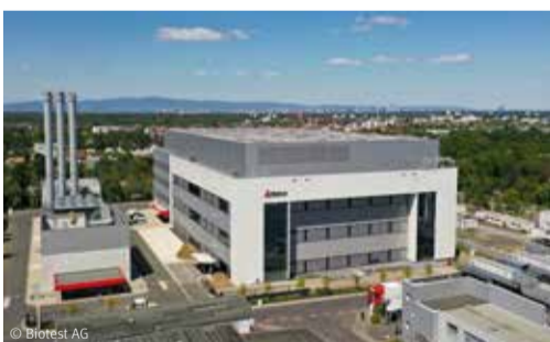
Biotest AG, Dreieich Neubau Produktionsgebäude