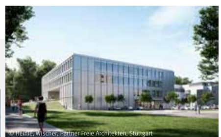
© Helmer, Wischer, Partner Freie Architekten, Stuttgart Multidimensionale Trauma-Wissenschaften, Ulm Neubau Forschungsgebäude

Wir begleiten Sie gerne auf dem Weg zum klimapositiven Unternehmen.