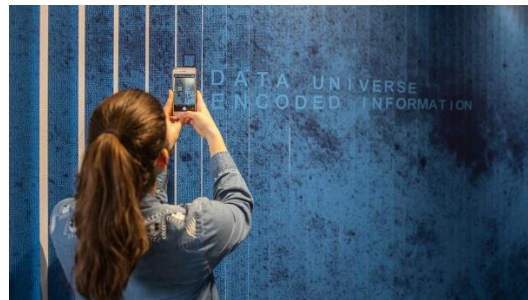
Bilder und Geschichten an den Wänden erzählen die doubleSlash-Story.

Ein weiteres Highlight ist der Erlebnisflur zum Konferenzbereich. Er führt in Bildern und Geschichten durch das doubleSlash Universum. Die Wände des Gangs erzählen in Motiven aus Nullen und Einsen, wie Zukunftsvisionen mit Technologien Realität werden und sich aus einer unfassbaren Menge an Daten digitale Mehrwerte generieren lassen. Hier werden Verkehrsflächen – durch Farbe und Atmosphäre, Inhalte und Bildsprache – nicht nur zu einem räumlichen Erlebnis, sondern dienen auch als Anknüpfungspunkt für Storytelling und Markeninszenierung.