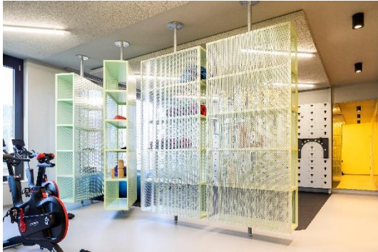
Der Wellbeing-Bereich bietet Möglichkeiten zum Auspowern...