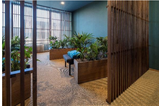
oder Entspannen ohne Ablenkung.